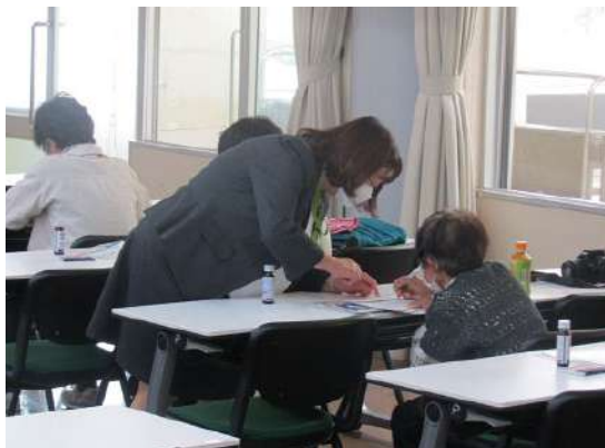
カルシウムチェック

5月18日(中部) ニーススポーツ教室 カローリング・シャフルボード・太極柔力球