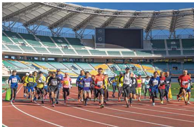
マラソン(12/18エコパスタジアム)