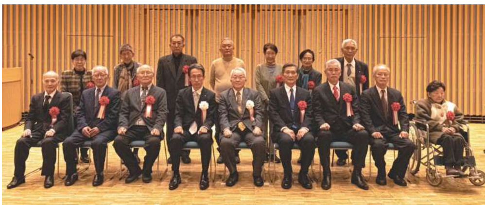
受賞された皆さん(出席者14名)、県局長、理事長

入賞した作品のうち、上位の14作品と最高齢者の2作品の表彰をグランシップ交流ホールで行いました。