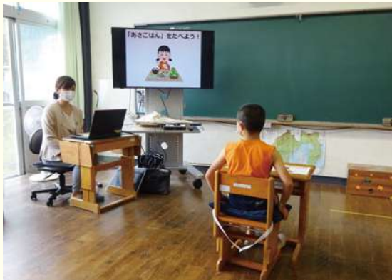
「あさごはんを食べよう」