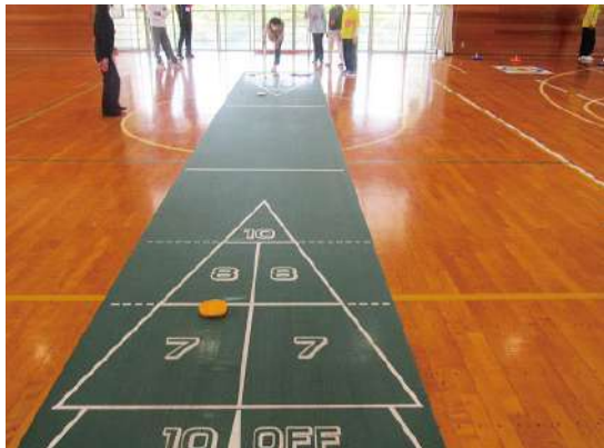
シャフルボード(シズウエル体育館)

カローリング、シャフルボード、太極柔力球の3種目を行いました。それぞれの種目6〜7名に分かれて約30分ごとに行い、ローテーションしていきました。競技説明も丁寧でわかりやすく、動きもゆるやかなので、高齢者でも十分に活動できるものでした。慣れきた頃には、力の入れ具合もわかり、参加者からは「もっとやりたかった。」「また参加したい。」などの声が多く聞かれました。