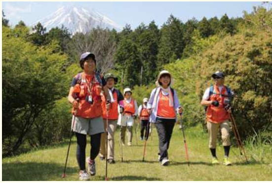
ノルディックウォーキングの様子

⑤適度な運動は、『閉じこもり』や『認知症』といった高齢化社会の課題に有効と言われています。仲間との交流や会話を楽しみながら、5kmのウォーキングで心とカラダを同時にリフレッシュしてみませんか。ノルディックウォーキングとは、専用のウォーキングポールを使って、カラダ全体をバランスよく動かせる運動です。専門講師が健康と安全に配慮し、丁寧にレクチャーするのであなたでも安心です。季節の花や山野草など自然を楽しみつつ、体を動かす楽しさも感じられます。