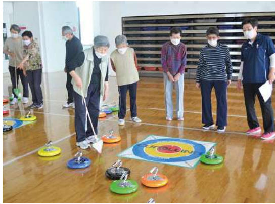
カローリング競技

ニーススポーツ教室「カローリング競技」が行われ、受講生28名が、沼津市「サンウエルぬまづ」4階多目的ホールで、日頃見慣れないジェットローラーの投球に興じていました。静岡県カローリング協会インストラクター指導の下、上達も早く4コート設置された会場には、絶えず笑い声と仲間への応援で盛り上がりを見せていました。いつまでも生き生きと、はつらつ人生を築き上げていきたいと思えます。