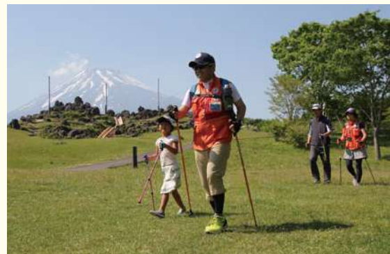
ノルディックウォーキングの様子