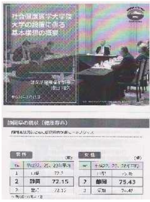
健康寿命シンポジウム2-s