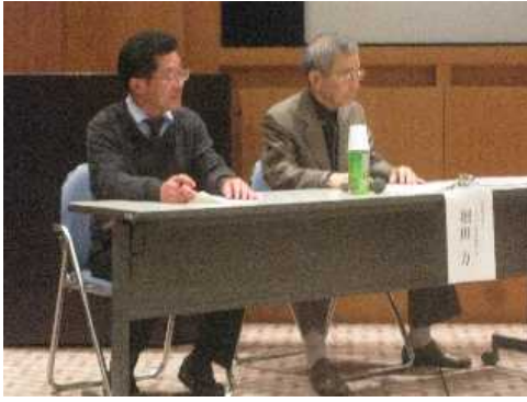
新しい地域支援を考えるフォーラム