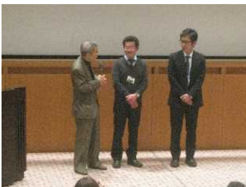
新しい地域支援を考えるフォーラム

会場の受付時間の13時を過ぎると、一般市民、自治会関係者、民生委員児童委員、医療事業関係者、福祉事業所関係者、NPO、ボランティア関係者等事前予約した人達が受け付けに訪れ会場の席は次々と埋まっていきました(写真)。