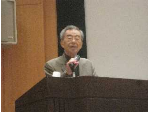
新しい地域支援を考えるフォーラム