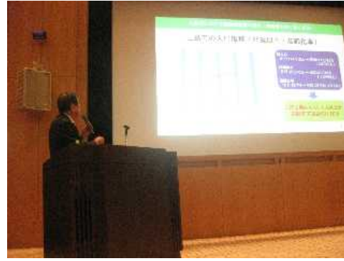
新しい地域支援を考えるフォーラム

12月19日三島市生涯学習センター3階講義室に於いて、『新しい地域支援を考えるフォーラム～住んでいて良かったと思える地域を目指して～』が開催されました。