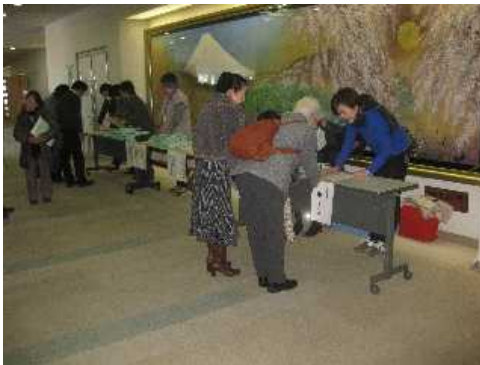
新しい地域支援を考えるフォーラム

シニア向け運動教室や体操サポーター養成講座の開催、笑って動いて認知症予防「わははの会」等々積極的に取り組んでいる事や、今回のテーマでもある地域主体の取組として「居場所づくり」について紹介されました。