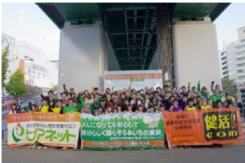
がんのピアサポーター活動

「自分の体験や知恵が同じ悩みを持つ仲間の力になれば」との思いで始めたピアサポート活動、「相談者の力になることで自分も癒されている」「自分の居場所があり生きるエネルギーをもらっている」自分が置かれている場所や立場で、精一杯努力し明るく光り輝きたい「がんと向き合いつつ幸せ・安心・希望を探して、自分らしく生きていこう！」