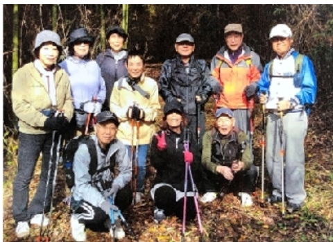
ノルディックウォーク