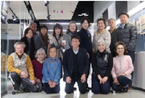
DSプリルト サンウェル 絵手紙教室

私たちは富士山と駿河湾にいだかれた風光明媚なまち沼津、この街に暮らしこの街を愛するメンバーが第二の人生＝セカンドライフを楽しむため、地域で新たな活躍の場を見つけ、地域で光り輝き、新しい仲間と地域社会のお役に立ちたいと願っています。