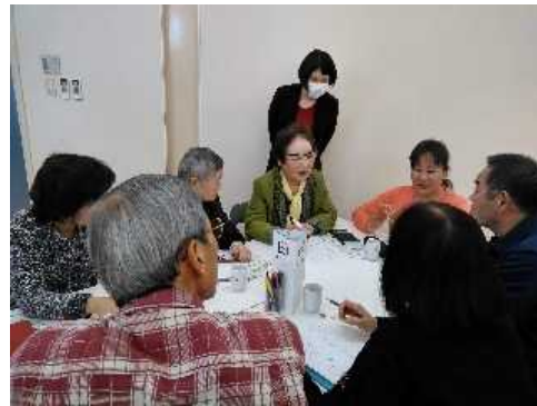
居場所をやってみたい

まず始めに視察した「森のこかげ」さんで感じたことを一人ずつ。「自分たちも来る方も楽しく、という前向きさを感じ、温かい家にいる感じがした」「コンスタントに活動を行くためには無償ボランティアでは難しさを感じる。公的な援助が欲しい」「運営に男性の関わりは必要。地域・家族の助けは欠かせない」などの感想とともに聞かれたのは、「あんなレベルのことはとてもできないけれど、もっと気楽に、できることからなら・・・」という言葉でした。今回立ち上げの意思を持つお二人も、自宅でご近所さんを対象に気楽にやりたい、という気持ちです。