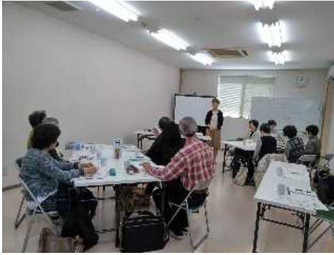
居場所をやってみたい