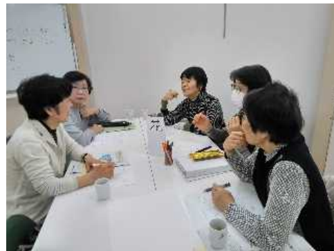
居場所をやってみたい