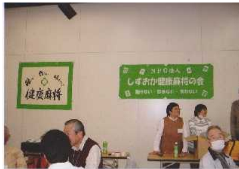
健康マージャン静岡県予選3