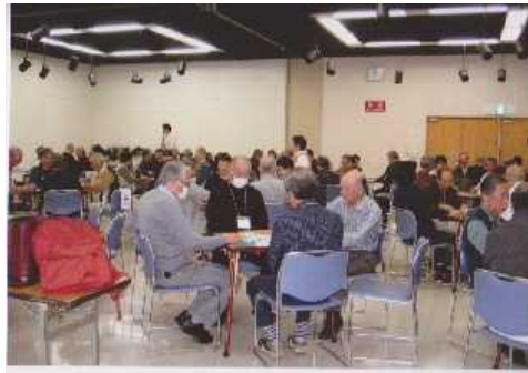
健康マージャン静岡予選タイトル