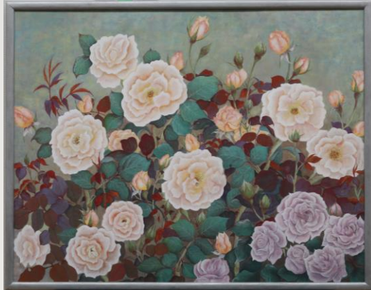
奏でる 大村千代子 71歳 菊川市