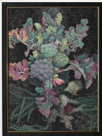
命をつなぐ 池谷千恵子 80歳 清水町