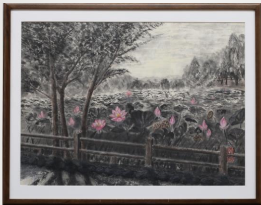
セピア色の風景 (丹波蓮池) 吉野 照信 68歳 富士宮市