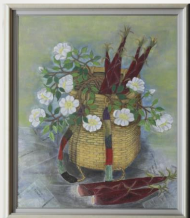
しよいかごとハチク 上田くに枝 79歳 沼津市