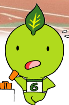
生きがいと健康づくり イメージキャラクター 「ちやっぴー」 ©静岡県