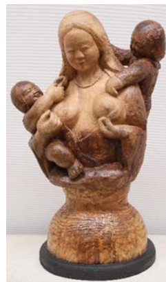
※写真は前回(第23回)の静岡県知事賞作品です