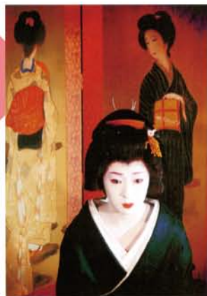
「凜」 制作者 石田 智鶴子さん(静岡市)