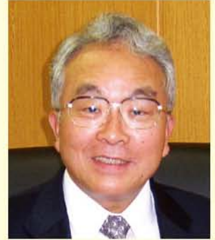
しずおか健康長寿財団理事長