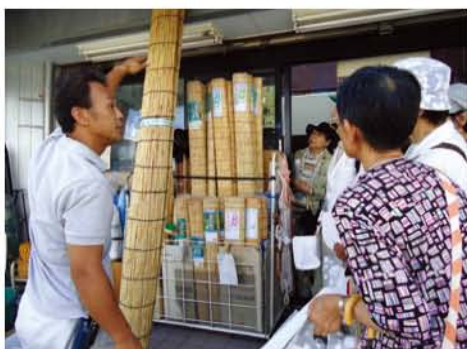
相良屋金物店にて、鞆簾・簾の話

今回は現在「スイーツの街」として売り出し中の藤枝駅周辺を散策。猛暑の中、駅周辺の隠れた名店巡りをしました。