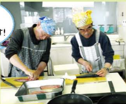
「おやじの料理」の皆さん(静岡市・アイセル21)