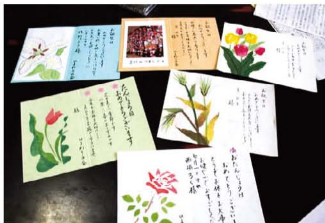
手作り誕生カード

や話し相手を、また『寄り合い処』のボランティアなどをしていきますが、「これからも、富士宮市民としての広い視点に立ち、今までの経験と知識を生かした活動を、可能な限り続けたいと思っています。」と、尽きる事のないボランティア活動への想いを、熱く語ってくれました。