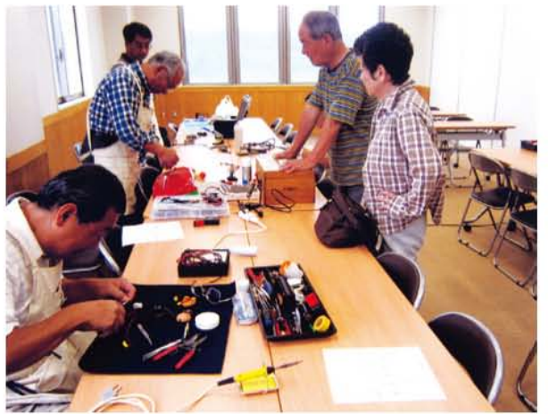
ただいま おもちゃ治療中! (浜松市西部清掃工場)

おもちゃ病院は、浜松市西区の和地公民館(原則第4日曜日)と西部清掃工場(原則第2日曜日)