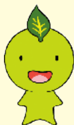
生きがいと健康づくりイメージキャラクター ちゃっぴー